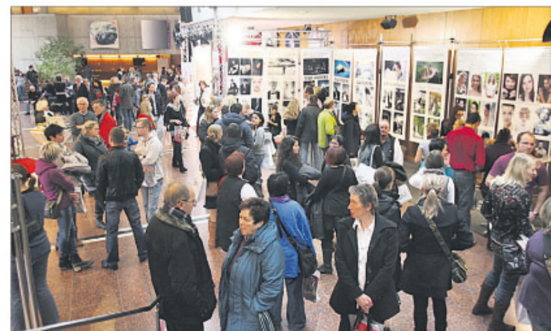
Rund 4000 Besucher nutzten die Vielfalt an Angeboten rund um den schönsten Tag im Leben, um sich Anregungen zu holen. Viel Lob gab's fürs Ambiente.

Als „schade“ empfand die Organisatorin den Umstand, dass sich unter den 50 Ausstellern nur sechs Gmünder Firmen fanden. Obwohl im Vorfeld 170 angeschrieben und der Handels- und Gewerbeverein angesprochen worden war.