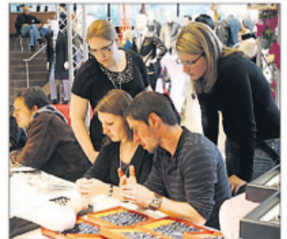
Welcher Ring passt am besten? Viel Zeit für Beratung war garantiert.